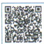
WAGNER FELIPE DE OLIVEIRA VILAR PREFEITO CONSTITUCIONAL

Assunção – PB, em 03 de fevereiro de 2025