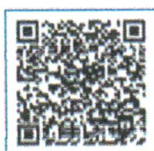
WAGNER FELIPE DE OLIVEIRA VILAR PREFEITO CONSTITUCIONAL

Assunção – PB, em 03 de fevereiro de 2025.