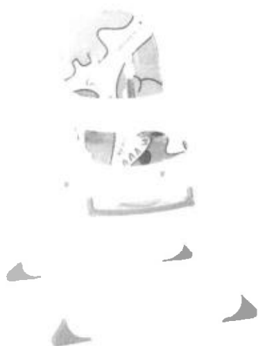
Cadeira Alta Nick Dino