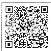
WAGNER FELIPE DE OLIVEIRA VILAR Prefeito