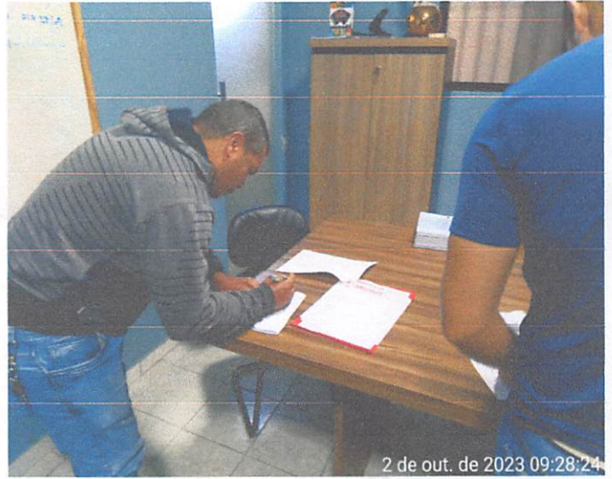
2 de out. de 2023 09:28:24