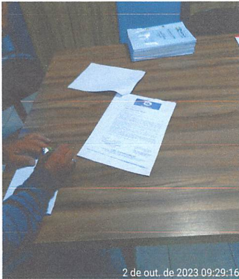
2 de out. de 2023 09:29:16