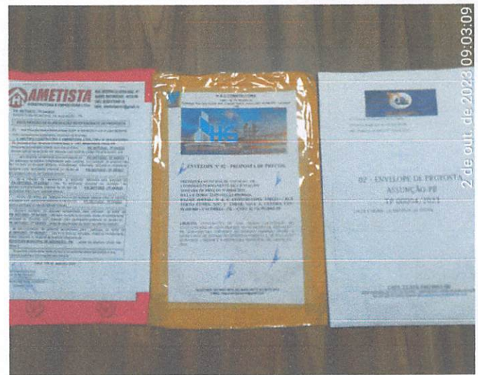
2 de out. de 2023 09:03:09